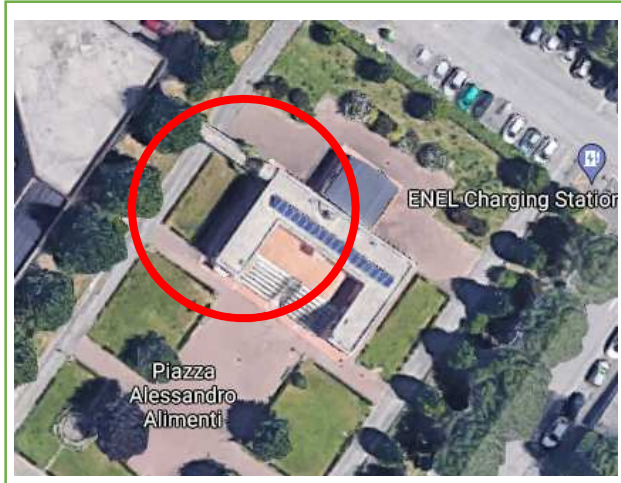
Estratto da Google™ Maps