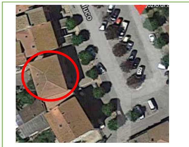
Estratto da Google™ Maps