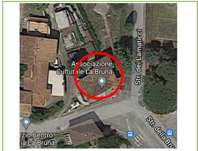
Estratto da Google™ Maps